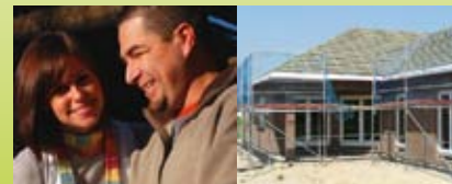
til dit ufærdige hus