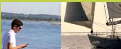
i din båd eller campingvogn