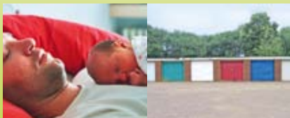
i din garage