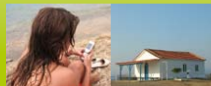
...eller i dit sommerhus